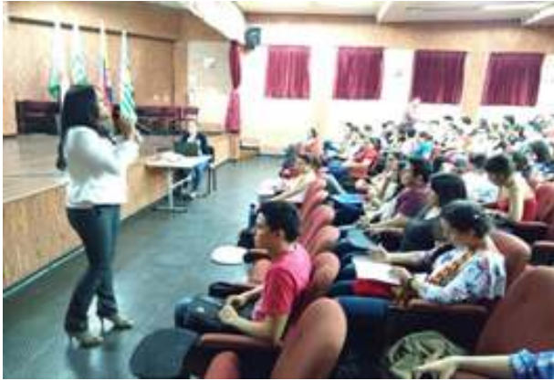
Conferencia “La Auditoria Frete al Excepticismo Profesional” ASFACOP. Dia del Contador Marzo 2018.