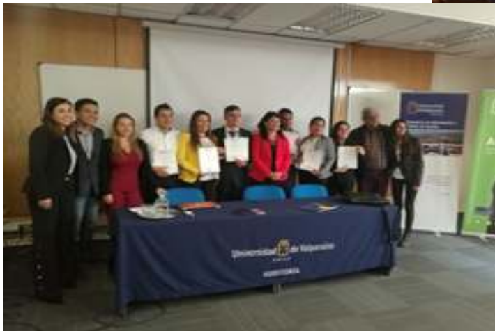
Visita de Estudiantes a Universidad de Valparaiso – Viña del Mar – Chile