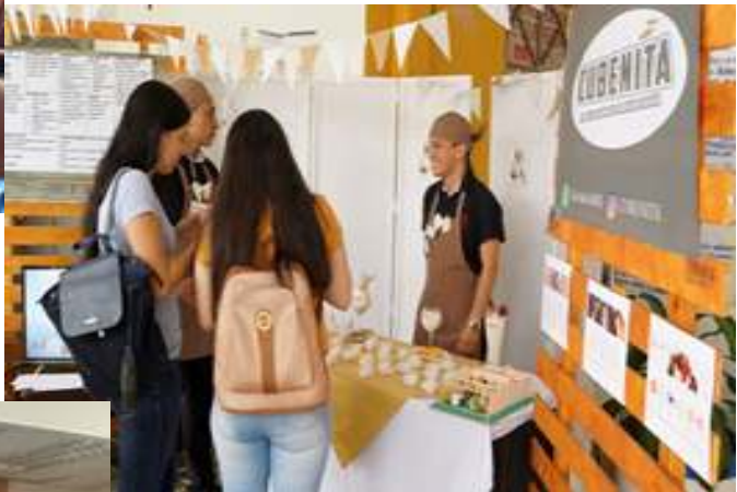
Muestra de Emprendimiento, Día del Contador, 2018